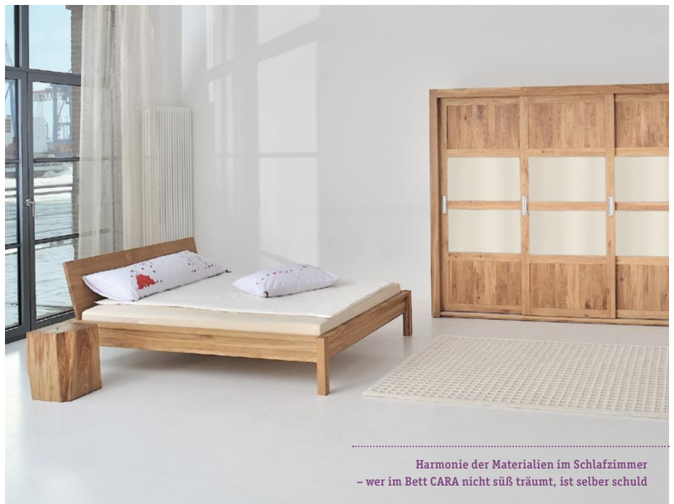
Harmonie der Materialien im Schlafzimmer – wer im Bett CARA nicht süß träumt, ist selber schuld

In Zeiten steigender Allergikerzahlen kann es nicht schaden, sich auf Materialien verlassen zu können, die ohne Verwendung schadreicher Inhaltsstoffe auskommen. Bei der Oberflächenbehandlung braucht man keine Chemiekeulen zu befürchten, da das Holz nur mit natürlichen Ölen und Wachsen in Berührung kommt. „Unser Holzöl kommt beispielsweise nach unseren Wünschen hergestellt von der Firma Lainos bei Buxtehude. Uns ist das sehr wichtig, da wir wollen, dass die Oberfläche gut geschützt ist, aber matt und im Naturlook bleibt. vitamin design hat eine eigene Produktion in Litauen, da es dort erheblich günstiger ist, aber alles andere – auch das Know-how – kommt aus Deutschland“, erläutert der Geschäftsmann, der durch diese Tatsache seine Vollholzmöbel zu einem exzellenten Preis-Leistungsverhältnis anbieten kann. Der Wegfall von Umweltbelastungen