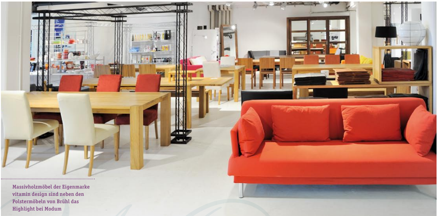
Massivholzmöbel der Eigenmarke vitamin design sind neben den Polstermöbeln von Brühl das Highlight bei Modum