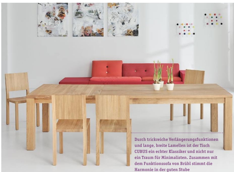
Durch trickreiche Verlängerungsfunktionen und lange, breite Lamellen ist der Tisch CUBUS ein echter Klassiker und nicht nur ein Traum für Minimalisten. Zusammen mit dem Funktionssofa von Brühl stimmt die Harmonie in der guten Stube

Adressen & weitere Informationen finden Sie bei uns auf: www.residence-hamburg.de | sa